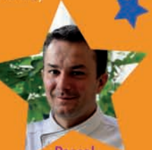
Pascal NIBAÚDEAU «Le Pinasse Café» (Cap Ferret)

17H30 Course de pinasses traditionnelles à rames et au flambeau proposée par l'association David Allègre / Entrée du port